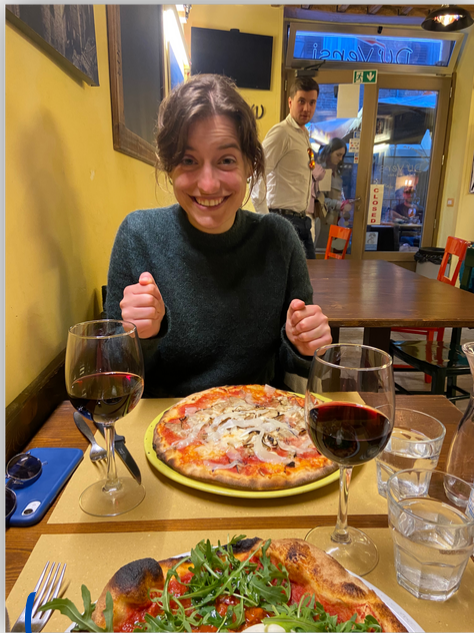
Le bonheur en 1 photo

Ensuite on s'octroie un peu de tourisme sous les recommandations de nos nouveaux amis toscans, on va même se baigner dans des thermes à 35°. Une folieeee. Et Pia a refait la journée d'un petit de 10 ans, qui a sans doute compris qu'il aimait les femmes à l'instant où la serviette de notre forkeuse glissa pour laisser entrevoir son popotin au plus offrant . Tqt Diego, Cha garde un œil sur la cougar . On visite ensuite Sienne, ville emblématique de la Toscane et qui restera surtout dans la mémoire de Cha : 1ère pizza sans gluten au resto pour notre forkeuse depuis des années !!! Une pizza, un verre de vin, une gelato cioccolato fondente, histoire de clôturer en beauté cette magnifique journée ! 🍷🍷 🍕