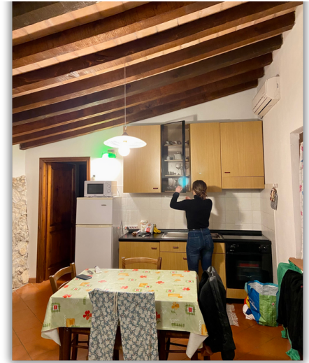
Gîte 5 étoiles des forkeuses

Giga surprise : ils nous ont réservé un de leurs gîtes pour notre séjour chez eux !!! Tellement reconnaissantes et heureuses d'avoir un vrai lit, une douche et des toilettes à proximité immédiate, on est "sous le choc" face à tant de générosité de la part de quelqu'un qui ne nous connaissait même pas ! Fabiano rentre et on dîne tous les 3, on découvre enfin le personnage : il a vécu 15 ans à Paris, a écrit une thèse sur la mécanique des fluides, puis a été photographe en Arctique et travaille maintenant avec ses parents depuis 10 ans dans leur ferme en agrotourisme. On vous laisse imaginer 😊